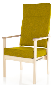
vizualizace polstrovaného křesla

materiál: dřevo bělený buk + polstrování čalounění: látkové, odolnost vůči oděru, využití materialu zpomalující hoření (DIN 4102) barva světle žlutá* výška sezení min 460 mm